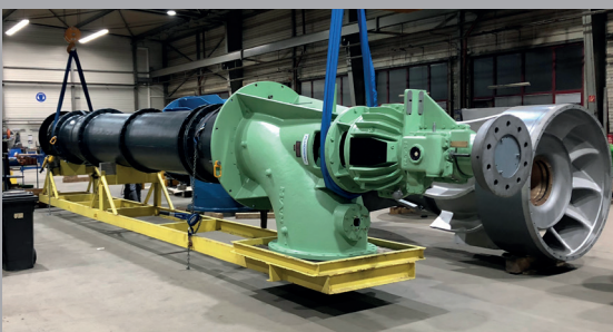
KA8 (175) II (MAN)