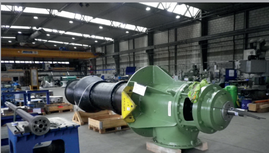
SEZ 800 (KSB)