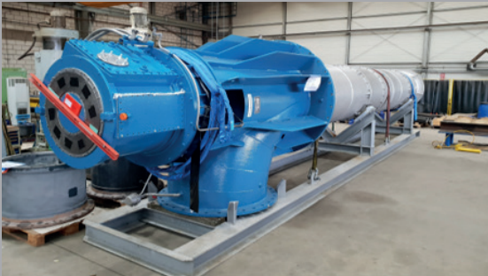
RKCA 12001 / 12002 (HALBERG)